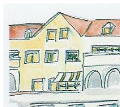
Ecole de Beauvallon

Mention « lu et approuvé » Dater et signer